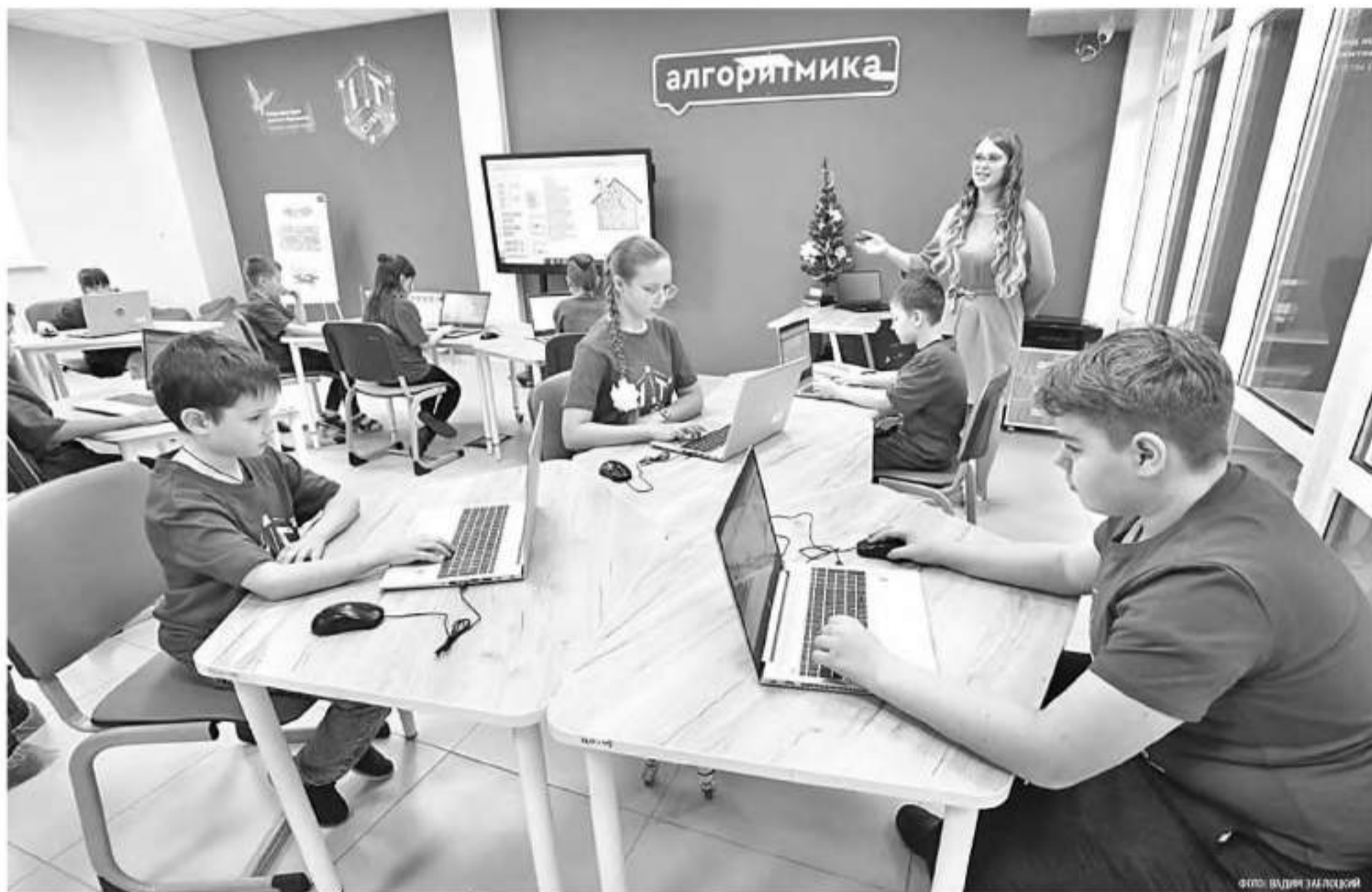
На занятии алгоритмикой в IT-кубе

КАК УПРАВЛЕНЧЕСКИЙ АСПЕКТ ОБНОВЛЕНИЯ СОДЕРЖАНИЯ ОБРАЗОВАНИЯ ПОМОЖЕТ ДОСТИЖЕНИЮ НАЦИОНАЛЬНЫХ ЦЕЛЕЙ И СТРАТЕГИЧЕСКИХ ЗАДАЧ