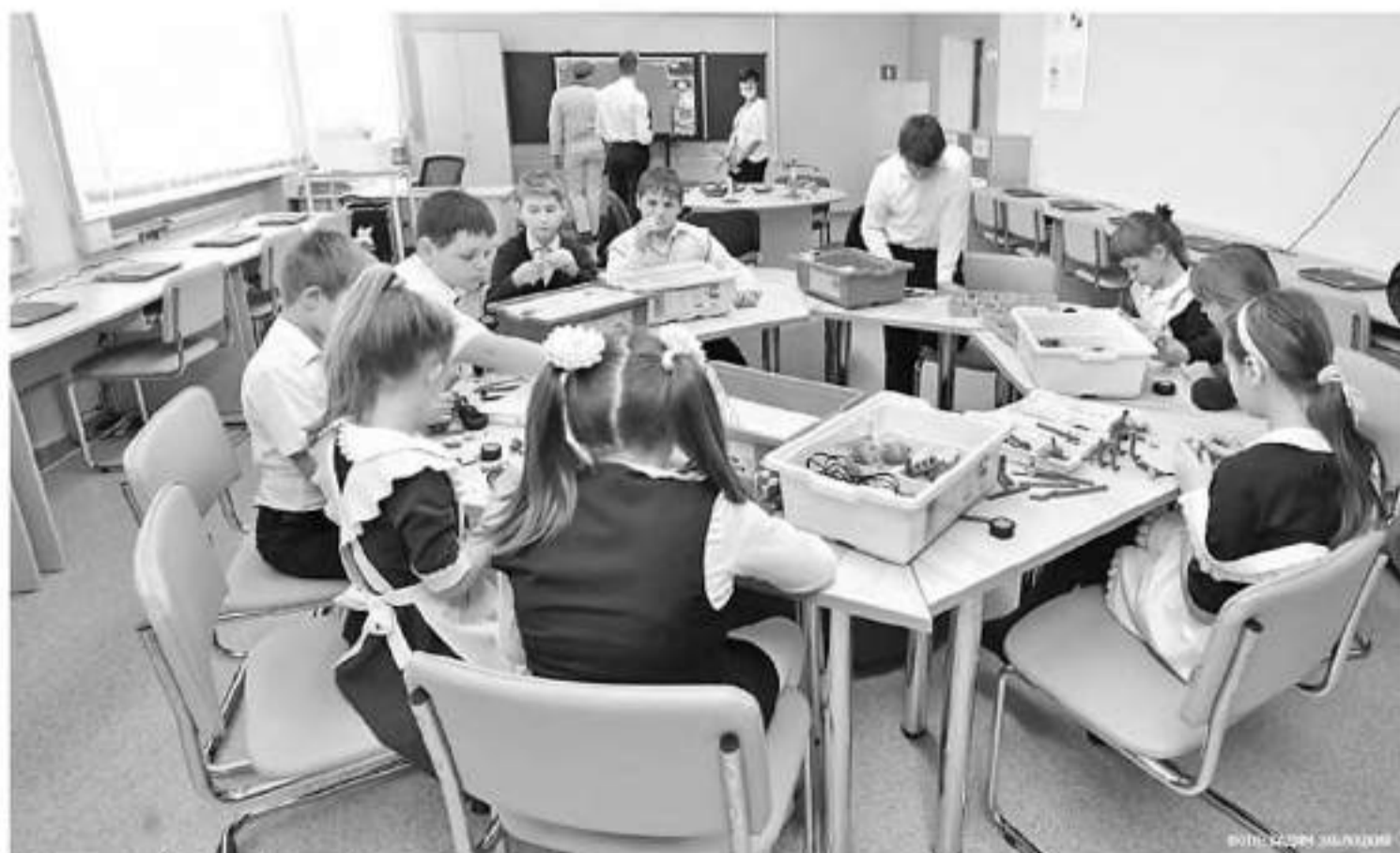
В «Точке роста» Алексеевской школы Корочанского района